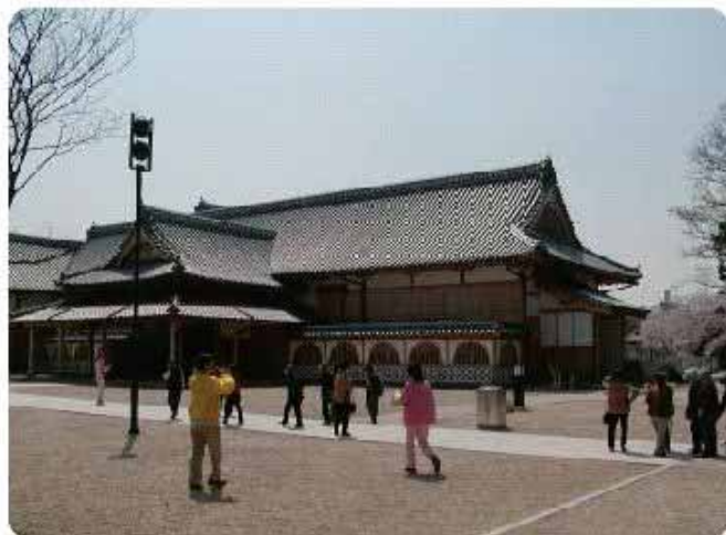
佐賀城本丸歴史館

佐賀城本丸歴史館と連携した観光拠点形成 住民と連携した地域振興の活動おこし 地元住民が観光客をもてなす場づくり