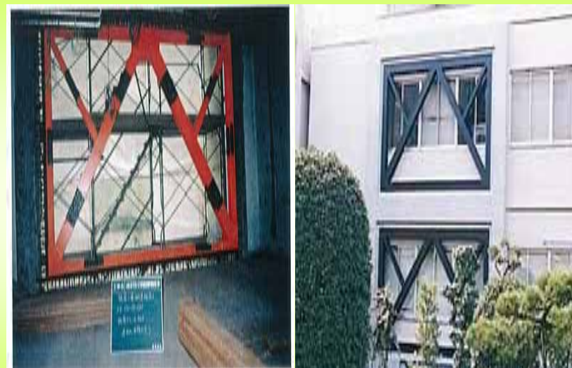
鉄骨ブレースの設置