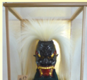
鹿島：梶原一龍作 佐賀浮立面