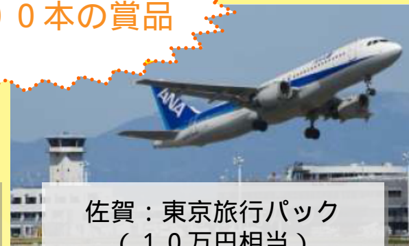
佐賀：東京旅行パック (10万円相当)