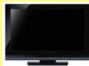
伊万里・小城： 大型液晶テレビ