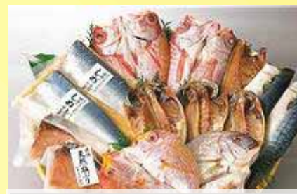
唐津： 唐津うまかもんセット (10万円相当)