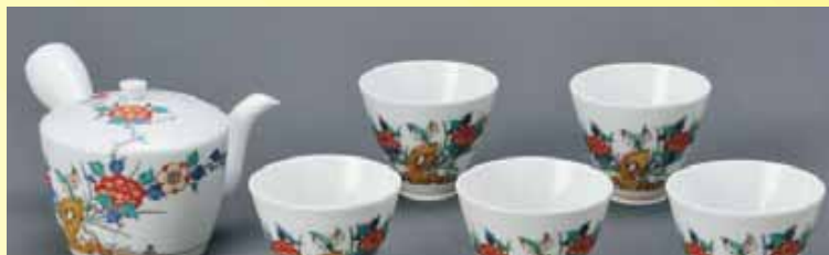
有田：柿右衛門窯 牡丹鳥文 横手茶器