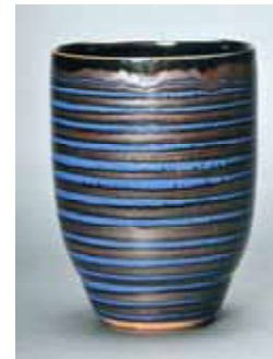
青韻譜(せいいんぷ) 平成12年作