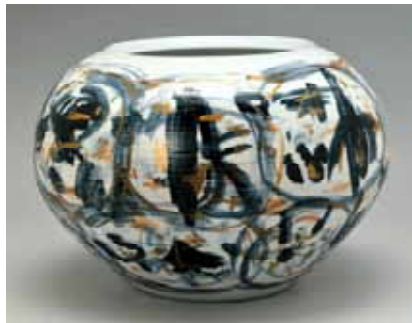
染錦「春の詩」 昭和37年作