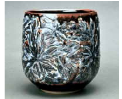
「想苑(そうえん)」 平成18年作