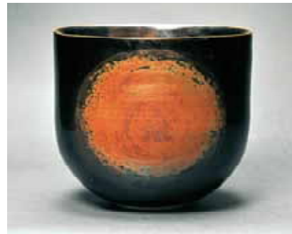
「月と太陽」 昭和46年作