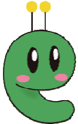
マスコットキャラクター ビコビコ