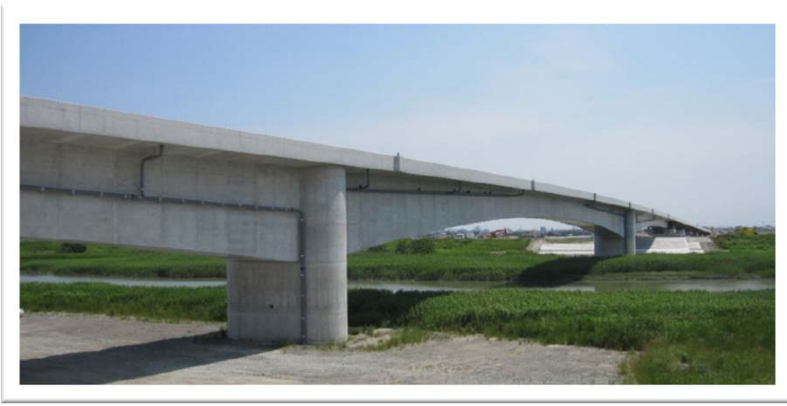
嘉瀬川を渡る710mの大規模な橋梁