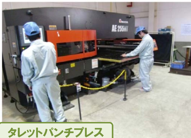
タレットパンチプレス