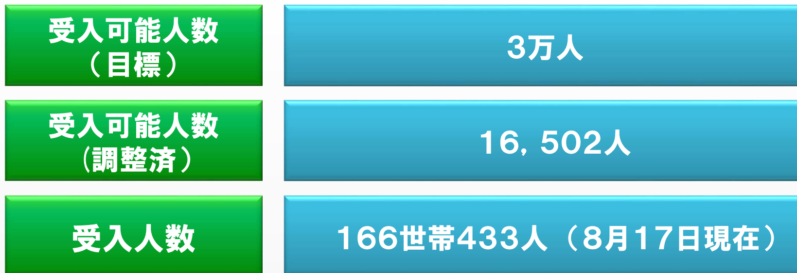
受け入れ可能数(8月17日現在)