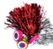
チェギ蹴り (韓国伝統遊び :羽根蹴り)