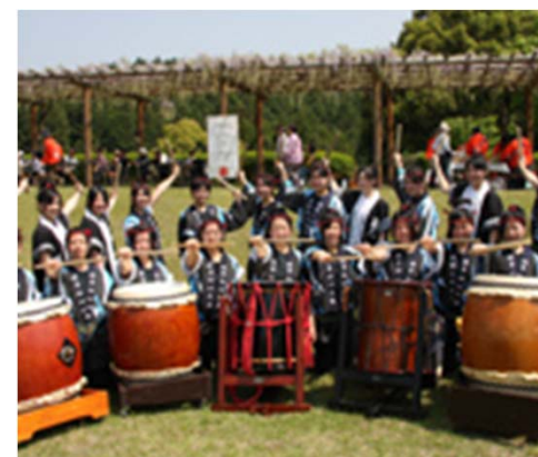
嬉野高校 嬉昇伝心太鼓