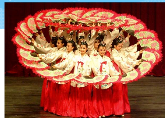
全羅南道芸術高校 扇子舞