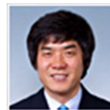
ユン・ジョン ファン監督