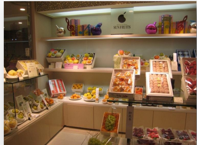
サン・フルーツ銀座三越店