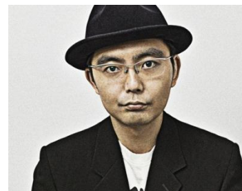
音楽 向井 秀徳 氏