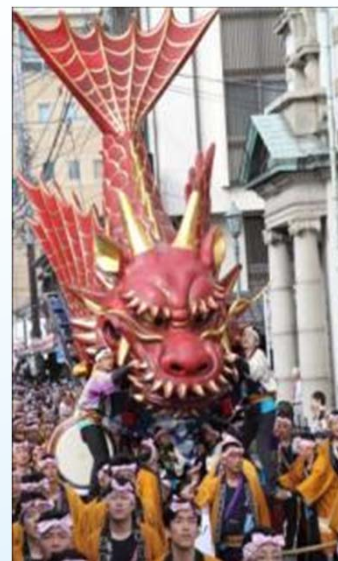
■ 唐津くんち (7番曳山飛龍) 町名:新町