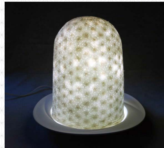
ランプシェード (コラボ先: 越前和紙)