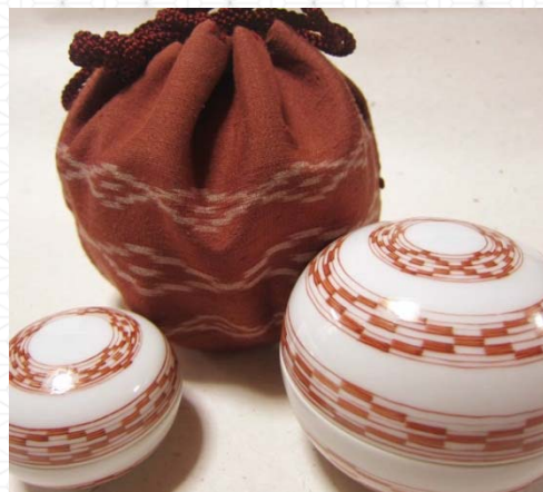
蓋物 (コラボ先: 琉球絍)