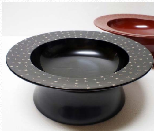
大皿、取皿 (コラボ先: 輪島塗)