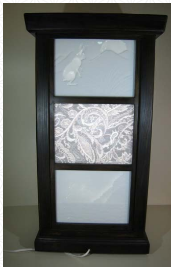
行燈 (コラボ先: 本場大島紬)