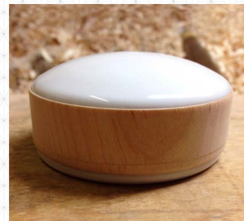
蓋物 (コラボ先: 山中漆器)