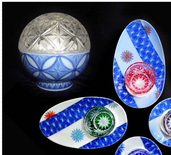
ランプシェード、ソーサーセット (コラボ先: 江戸切子)