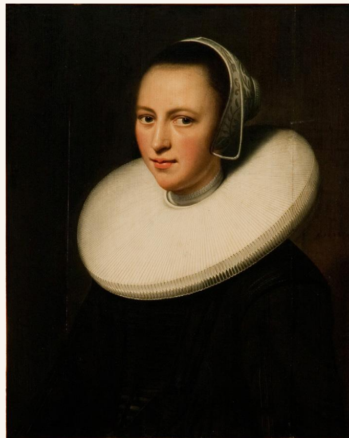
レンブラント《襷襟を着けた女性の肖像》 ヨハネ・パウロ2世美術館 蔵