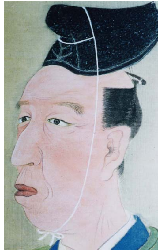
たく しげちか 多久茂鄰像(多久市郷土資料館蔵)