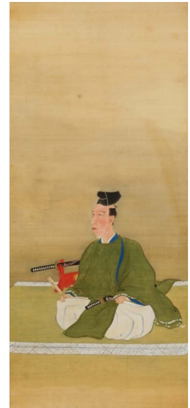
多久領主の肖像画