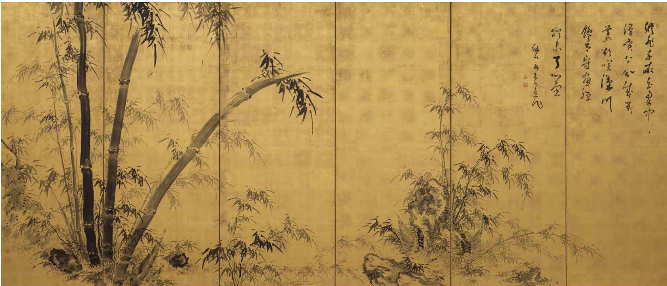
竹図金地屏風(左隻, 多久市郷土資料館蔵)【県立博物館展示】