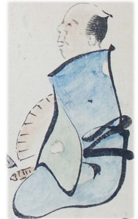
ばしんちょう 『婆心帖』(個人蔵)より 「侍」の字を入れた武士図 【県立博物館展示】