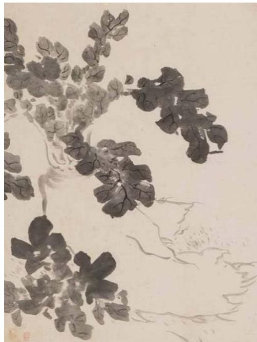
大根図(部分/博物館蔵)