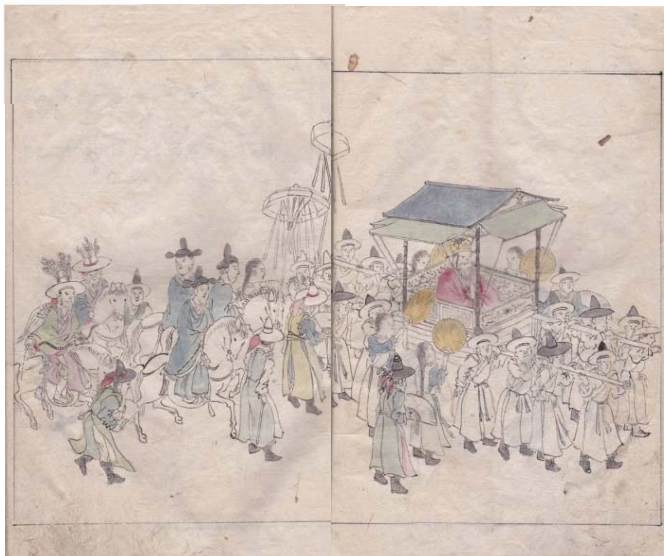
津島日記(多久市郷土資料館蔵)