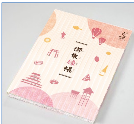
御朱縁帳イメージ

県内 134名 の「いadak人」は、県内10カ所に分けたエリアマップか、「いadak県、佐賀」公式WEBサイト( 11月25日から公開 )で探せます。