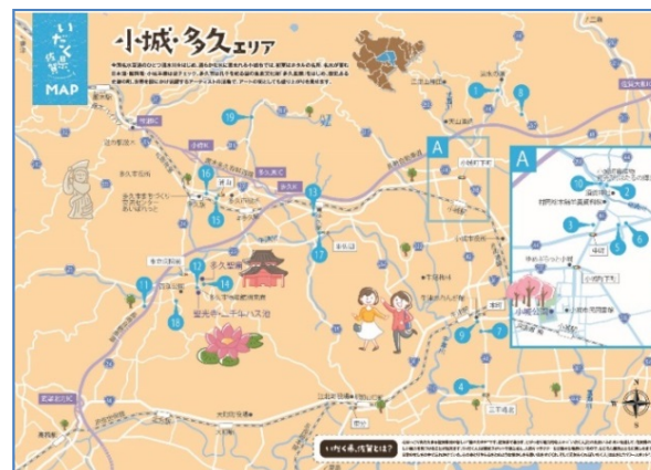
エリアマップイメージ