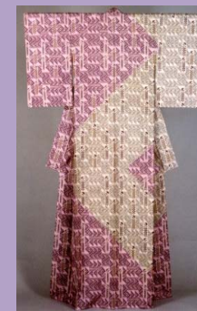
佐賀県立美術館蔵