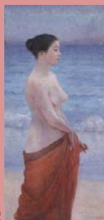
親和アートギャラリー蔵