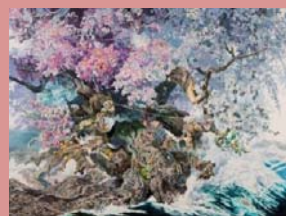
佐賀県立美術館蔵