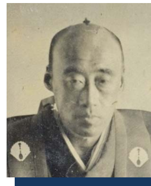
公益財団法人鍋島報効会蔵