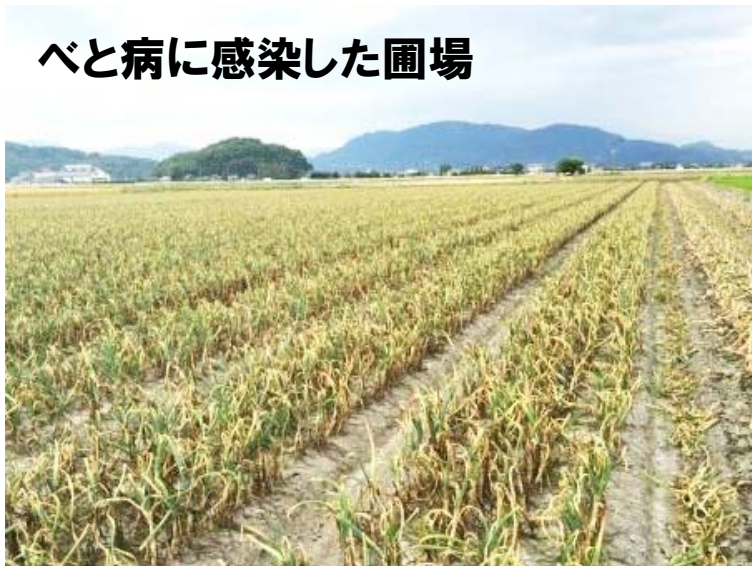
べと病に感染した圃場