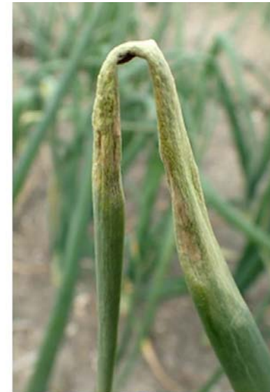
べと病に 感染した葉