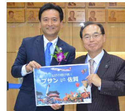
呉巨敦(オ・ゴドン)プサン広域市長