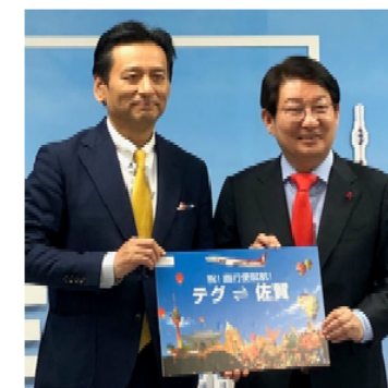
権泳臻(クォン・ヨンジン)テグ広域市長