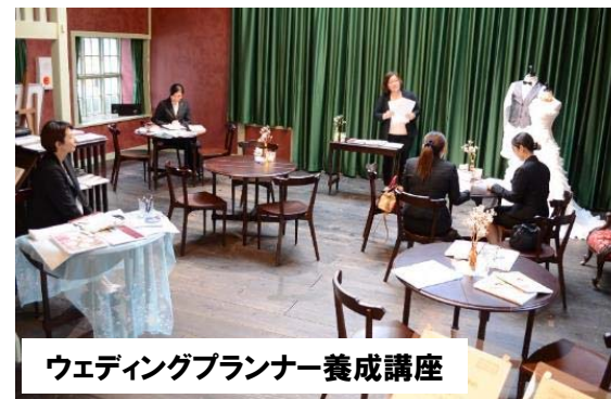
ウェディングプランナー養成講座