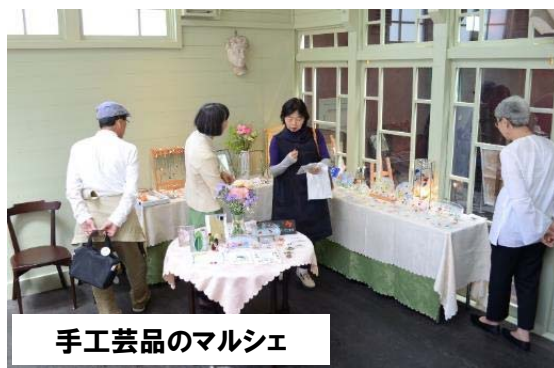
手工芸品のマルシェ

佐賀大学出身の気鋭の女性画家による アーティスト・イン・レジデンス (滞在制作)とワークショップ