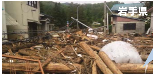
平成28年8月台風10号災害