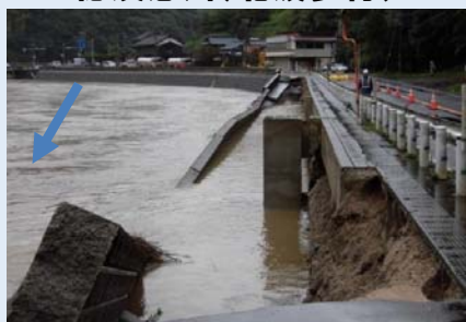
徳須恵川(北波多村)