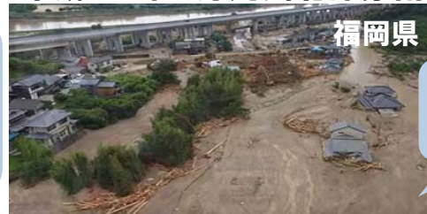
平成29年7月九州北部豪雨