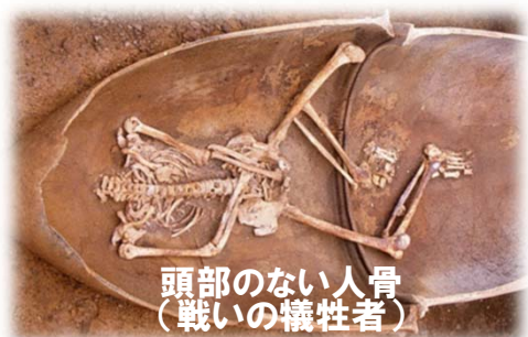
頭部のない人骨 (戦いの犠牲者)