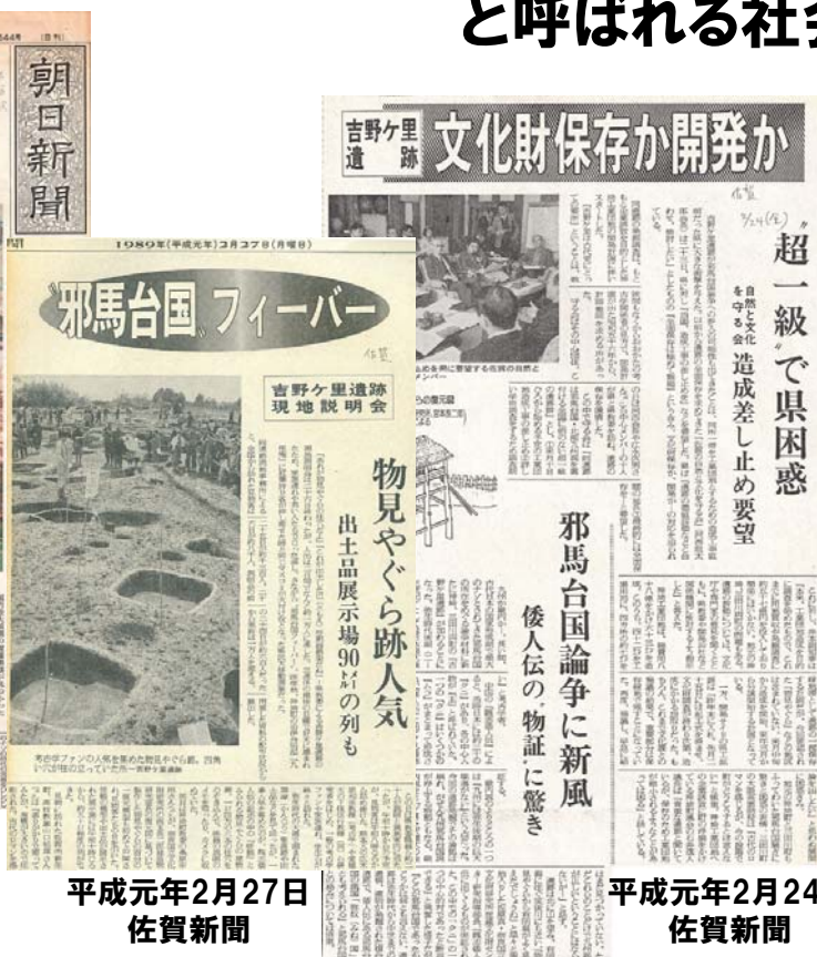
平成元年2月27日 佐賀新聞