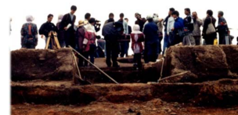
墳丘墓を取材する報道陣