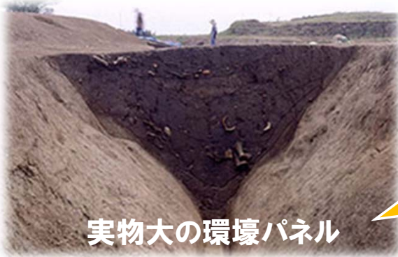
実物大の環境パネル