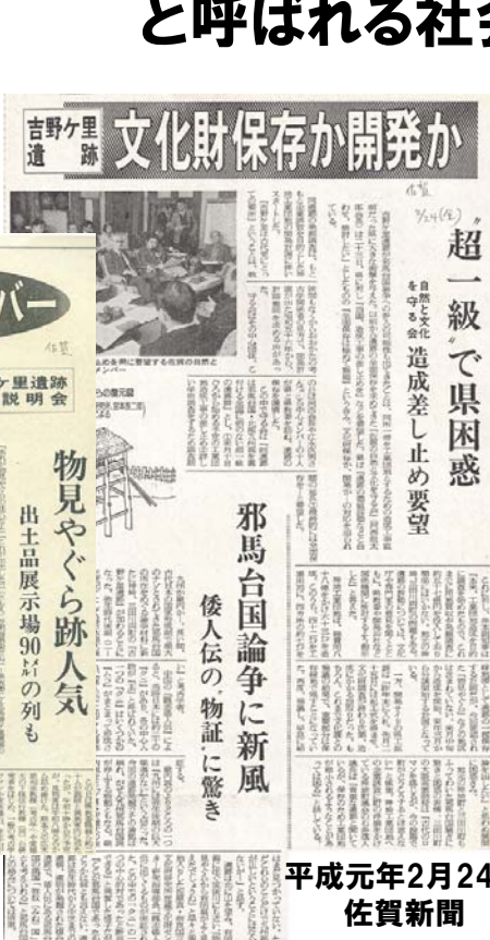
平成元年2月24日 佐賀新聞