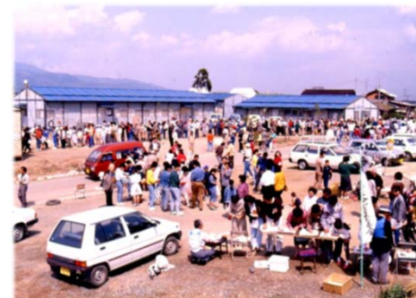
吉野ヶ里に押し寄せた見学者