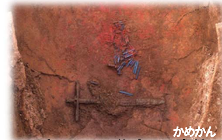
かめかん 吉野ヶ里を代表する甕棺