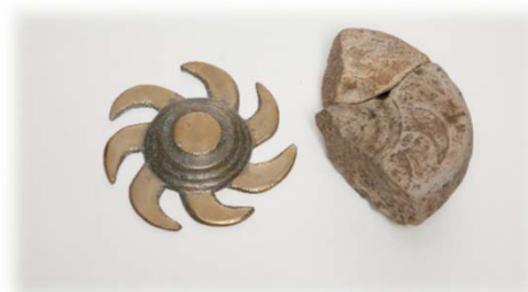
ともえがた 巴形銅器鑄型と復元品