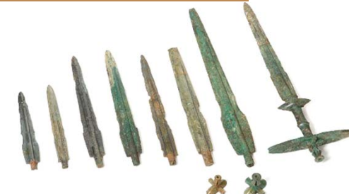
はとうしょくつ 把頭飾付き有柄銅剣・ ゆうへい 細形銅剣 (有力者が持つ銅剣)