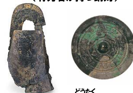
どうたく 九州初出土の銅鐸と銅鏡