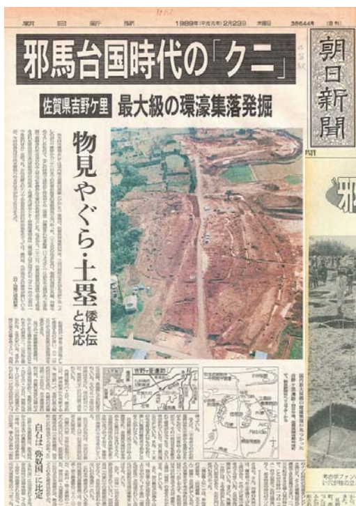
平成元年2月23日 朝日新聞