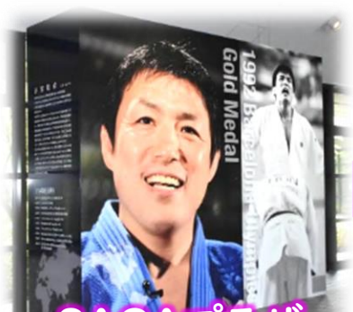
SAGAプラザ 古賀稔彦さん メッセージ紹介!