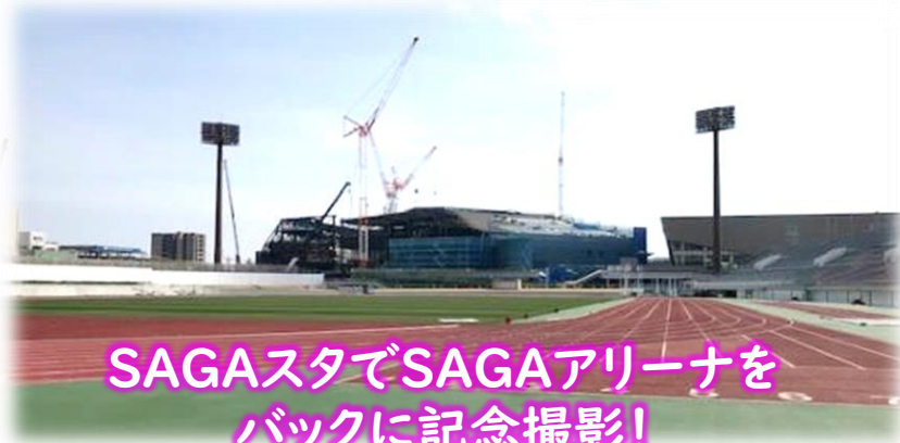
SAGAスタでSAGAアリーナを バックに記念撮影!