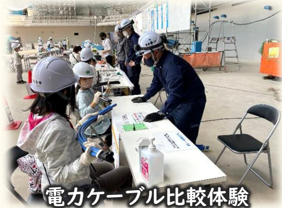
電カケーブル比較体験