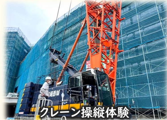
クレーン操縦体験