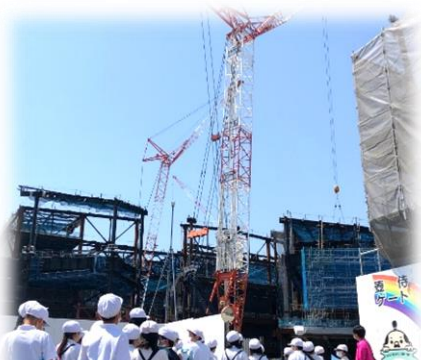
SAGAアリーナ 工事現場を間近で見学!