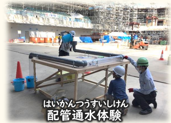
はいかんつうすいしけん 配管通水体験