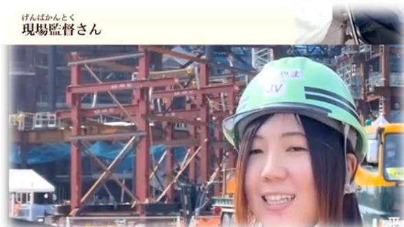
SAGAアリーナ 工事関係者紹介動画