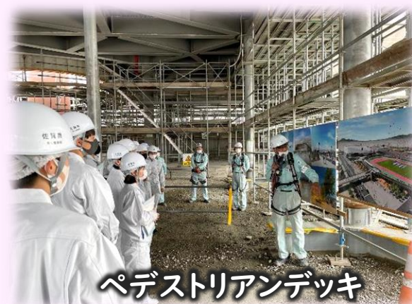
ペデストリアンデッキ