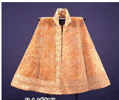
じんばおり 豊臣秀吉の陣羽織(名古屋市指定文化財) (名古屋市秀吉清正記念館蔵)