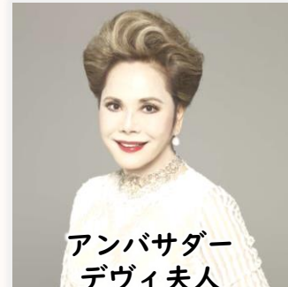
アンバサダー デヴィ夫人