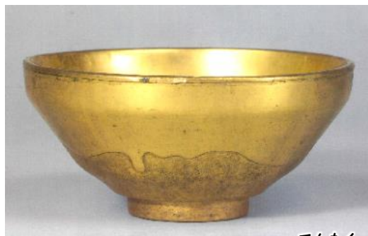
てんもく 豊臣秀吉から贈られた金の天目 (京都・醍醐寺(だいごじ)蔵)