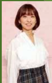
ゲスト 住吉美紀氏